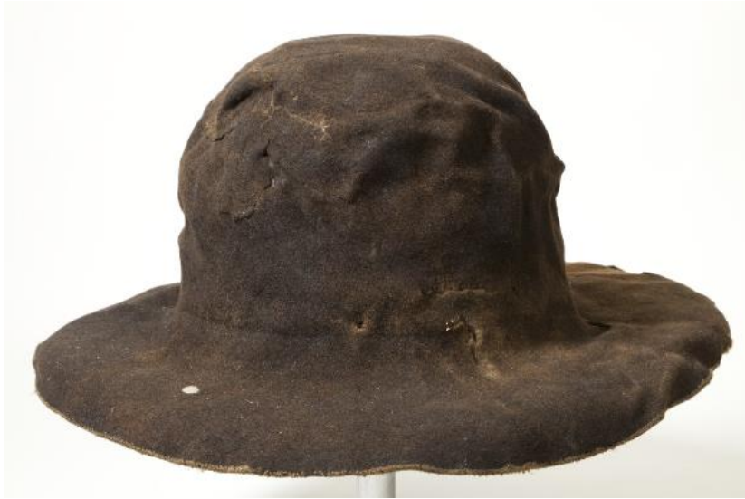
Hoed afkomstig uit een scheepswrak, ca 1593.

Het aanbod aan hoofddeksels in de boedels was zeer gevarieerd. Ze waren lang niet altijd bedoeld om veel warmte te geven, zoals een verfijnd 'swart mutsje met Goude stiftjens met goude haecken ende parlen', 'boommutsen' of 'treckmutsen'. Sommige hoofddeksels bedekten de oren niet, of waren lastig te dragen in de wind, zoals hoeden. Toch werden ook deze aan boord van schepen gedragen.