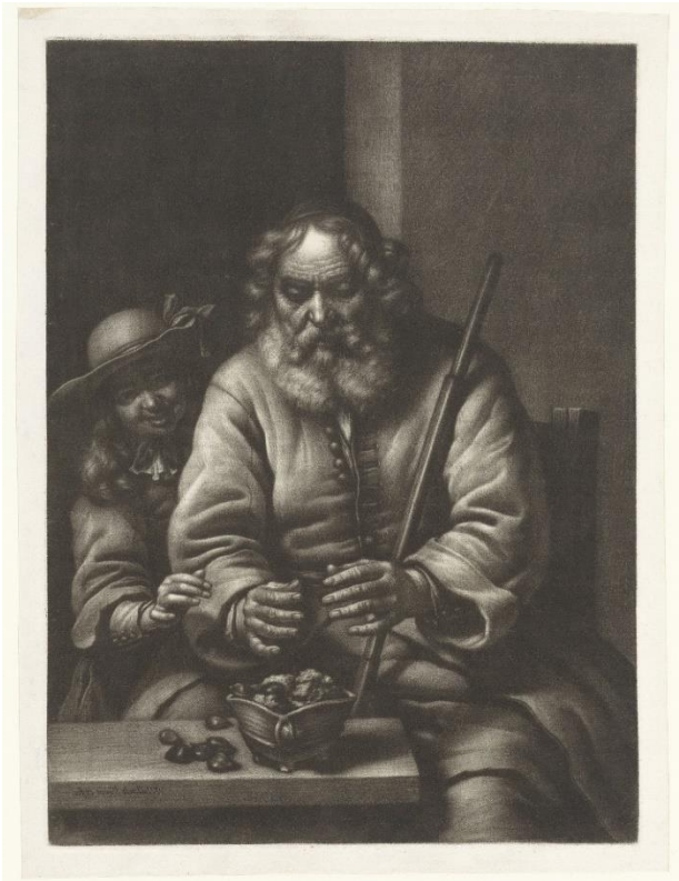
Een oude man warmt zijn handen aan een test met tamme kastanjes

Men kon de handen niet alleen tegen de kou beschermen, men kon ze ook bijvoorbeeld met een koperen balletje extra verwarmen. Mogelijk gebruikte men een dergelijk verwarmd voorwerp in een mof zodat het lang zijn warmte behield. En voor wie toch koude handen had gekregen zat er niets anders op ze te warmen boven een test van aardewerk of metaal gevuld met kooltjes of kastanjes, die enige tijd hun warmte behielden. Veel warmte gaven deze niet, maar alle beetje hielpen.