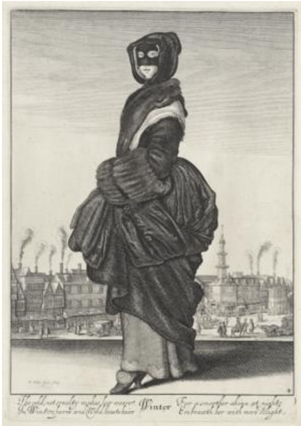
Vrouw als personificatie van de 'Winter', 1643. ( Rijksmuseum )

Het aangezicht moest het in de kou het meest ontgelden want kijken, ademen en praten gaan nu eenmaal slecht samen met afdekken van delen van het gelaat. Wie de snijdende kou moest trotseren en zich daarbij zorgen maakte om de huid, kon zijn toevlucht nemen tot een soort masker. Hieronder een gemaskerde Engelse vrouw gehuld in bont, de handen in een mof. De begeleidende tekst heeft veel weg van een hedendaagse reclame tegen een schrale huid: