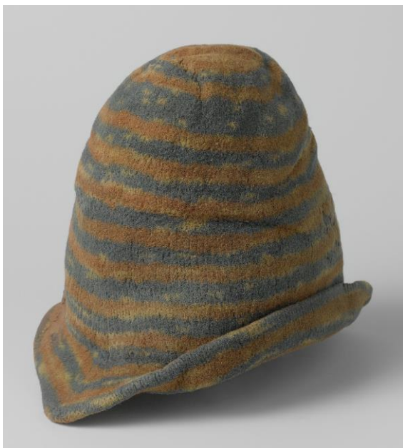
Wollen muts, ca 1650-1700 ( Rijksmuseum )

Mutsen die wel bescherming boden tegen de kou en wind zijn bijvoorbeeld gebreide wollen mutsen. Tal van deze mutsen uit de zeventiende eeuw van walvisvaarders en traankokers maakt deel uit van de verzameling van het Rijksmuseum. Ze werden door archeologen met de skeletten opgegraven in de jaren '80 van de vorige eeuw op Spitsbergen. De kleuren zijn nog sprekend door eeuwenlange conservering in de permafrost .